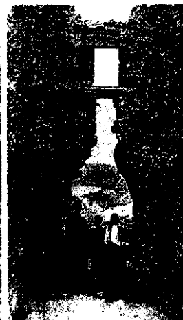
Vergissheden in de Languedoc. De streek grostiert in wijngaarden, eeuwenoude, vaak nog arme dorpen en bergen.