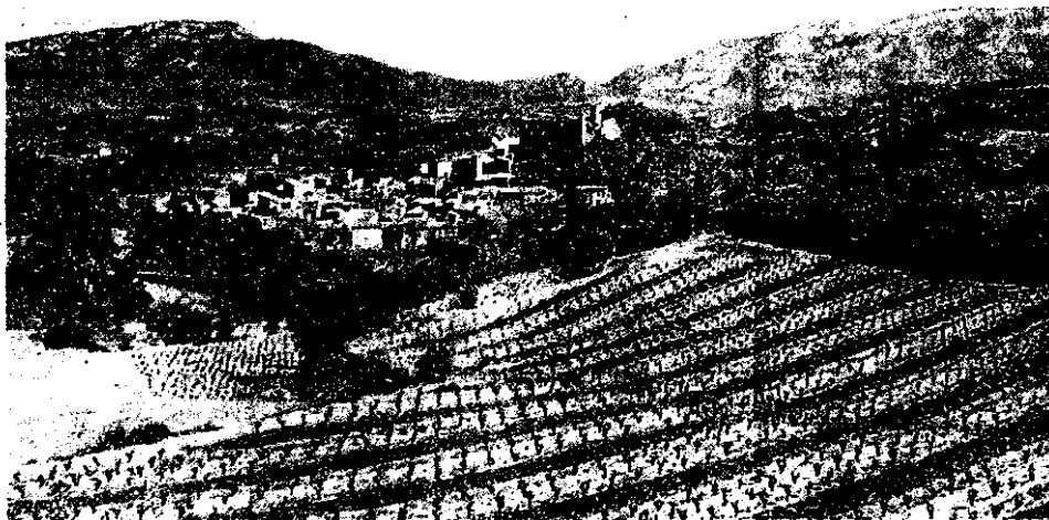
Het beklimmen van een Katharenburcht loont de moeite, zoals kasteel de Queyrus.

Informatie over de Languedoc (en Frankrijk): Maison de la France , Prinsengracht 670 1017 KX Amsterdam, tel 0900 11 22 33 2.